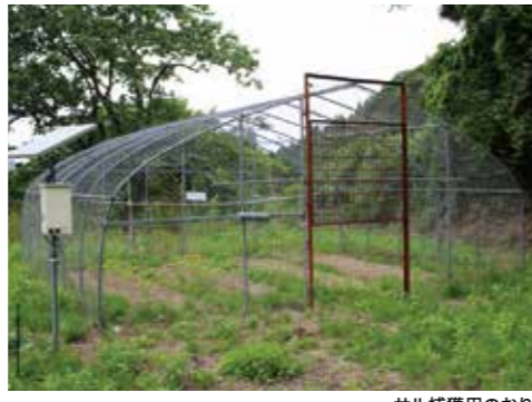
サル捕獲用のおり