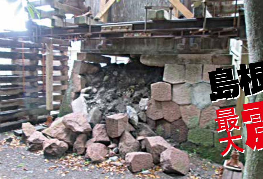
崩落した神社の石垣