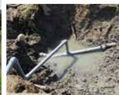
破損したパイプライン

大田市東部、三瓶地域を中心に畦畔及び石垣の崩壊や亀裂が発生し、大田市久手町の水田地帯では、灌漑のパイプ網が決壊しました。地震の被害を受けたほ場、18筆、260㎡を確認したところ、ほ場に水が溜まらず、田植えの遅れや、6筆58㎡で移植できませんでした。