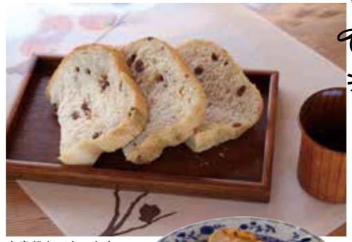
小麦粉もバターも良質の物を使っています