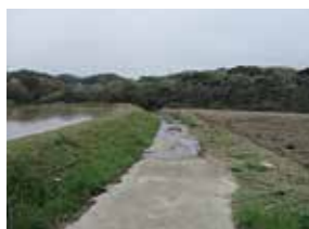
ほ場から農道へ漏水